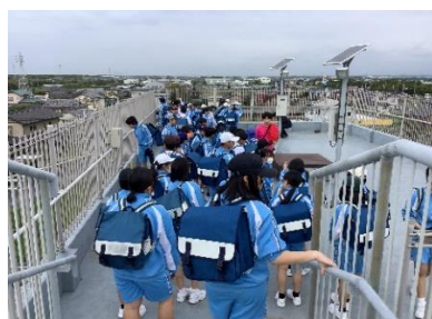
1年生防災ロゲイニング