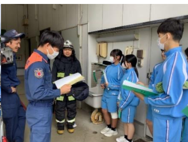
2年生職業インタビュー